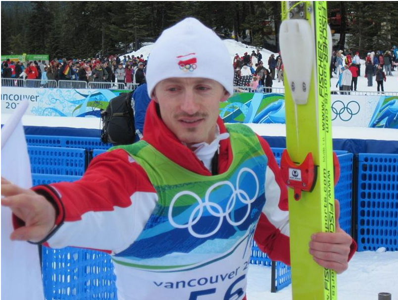
Adam Małysz podczas igrzysk olimpijskich w Vancouver w 2010 roku.