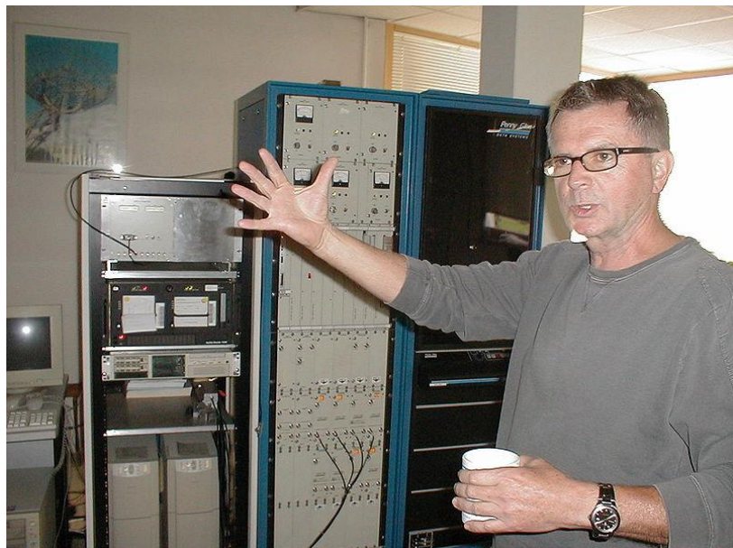
Aleksander Wolszczan w Piwnicach.