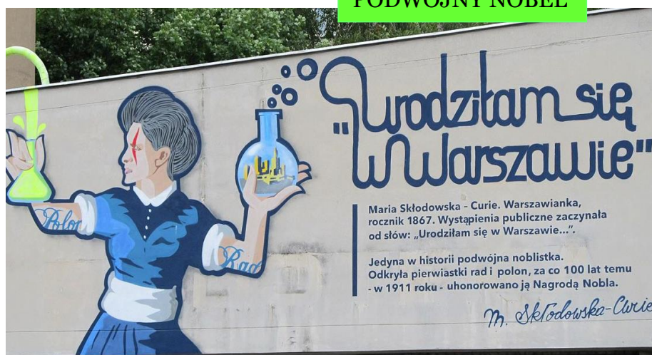
Warsaw Marie Skłodowska-Curie 2011