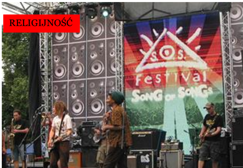
Dubiska Song of Songs