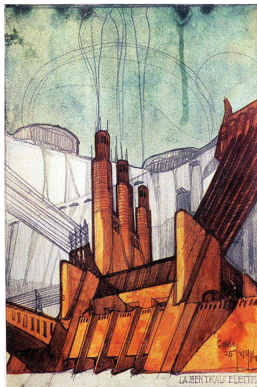
Centrale elettrica Sant'Elia, Wikipemedia Commons, Domena publiczna