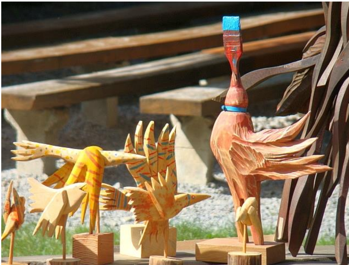
Conjured from Wood Festival, Wikimedia Commons, Sanok 1 CC BY-SA 3.0

Podziel się swoimi przemyśleniami z partnerem/ partnerką z tandemem.