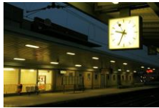
في محطة القطار