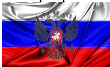
герб и флаг

выдающиеся деятели в сфере литературы, искусства, науки