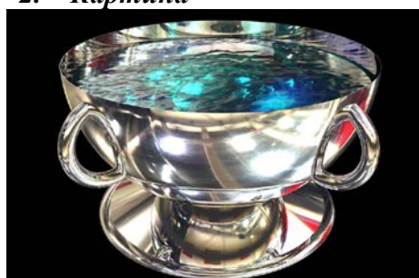
4. Блюдо из серебра

Что для Вас является произведением искусства? Почему одни вещи представляют художественную ценность, а другие нет? У Вас дома есть красивые вещи ручной работы? Что Вам в них нравится?