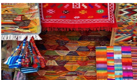
3. Ковер ручной работы