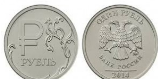
Изображение № 2