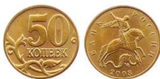
Изображение № 1

Посмотрите на картинки. На картинках Вы видите деньги в России. Как Вы думаете, это много или мало? Что можно купить на эту сумму?