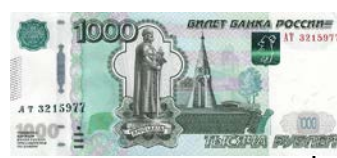
Изображение № 4