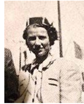
By archives familiales (1937, dédicace personnelle, archives familiales) via Wikimedia Commons. CC04