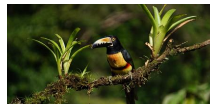
1 Woche quer durch Costa Rica