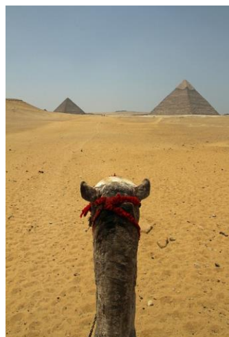
(allein) in der Sahara