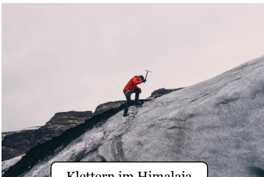
Klettern im Himalaja